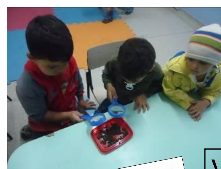
Verificação das hipóteses