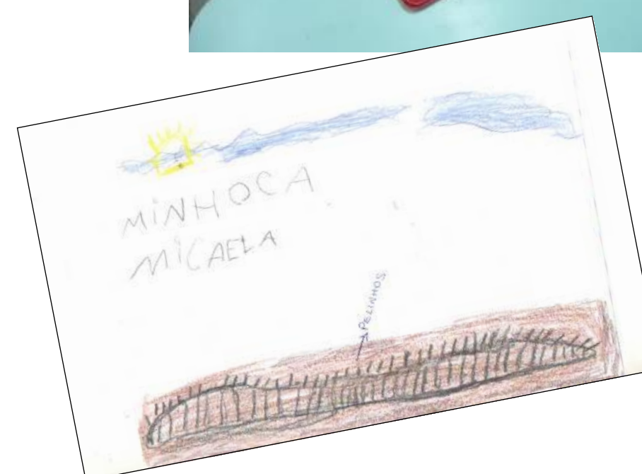
Exposição do trabalho